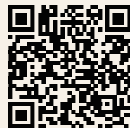
【申込み用二次元コード】

※申込み時にご記入いただく内容について、あらかじめ社内での記入許可をお済ませください。